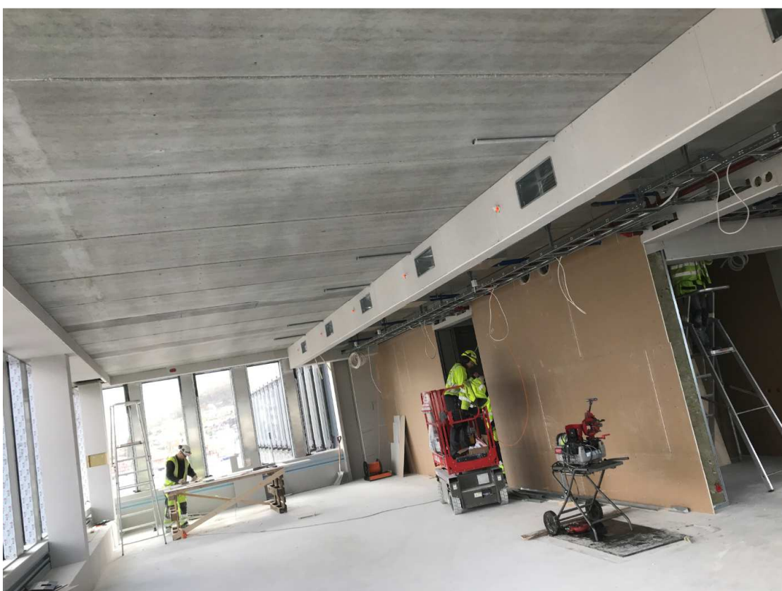
Kontor området 4. et. nord/vest