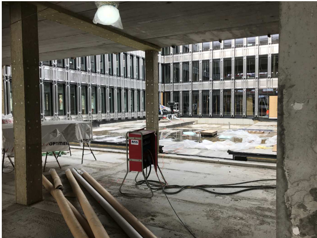
Ytterveggselementer atriet 2. et