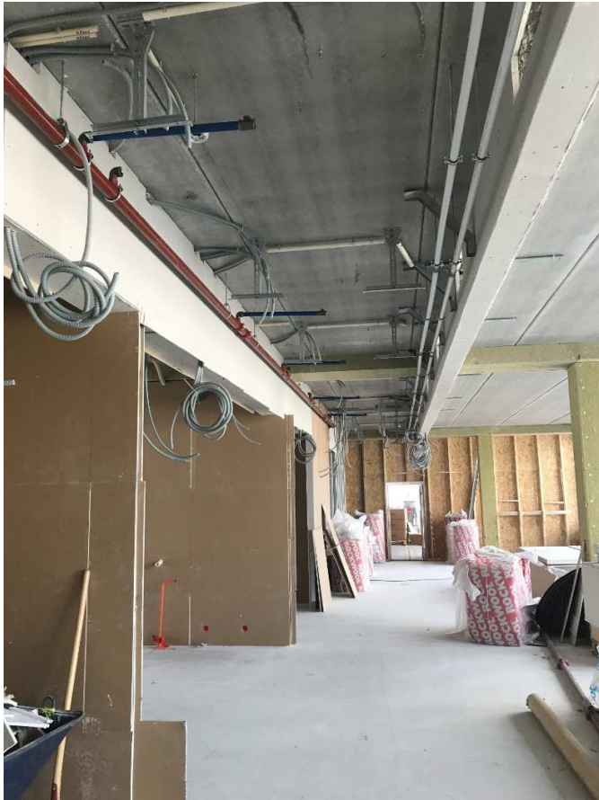
Kontor området 4. et. vest